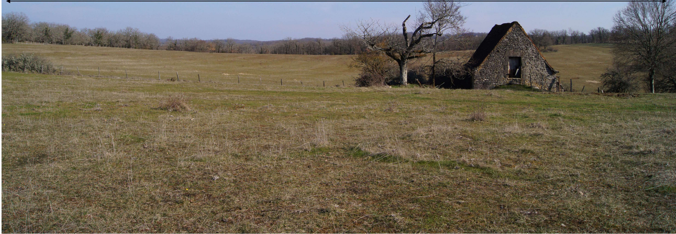
Point de vue n°3 - situé à l'ouest du site en direction de l'est

Localisation de l'emprise clôturée du projet