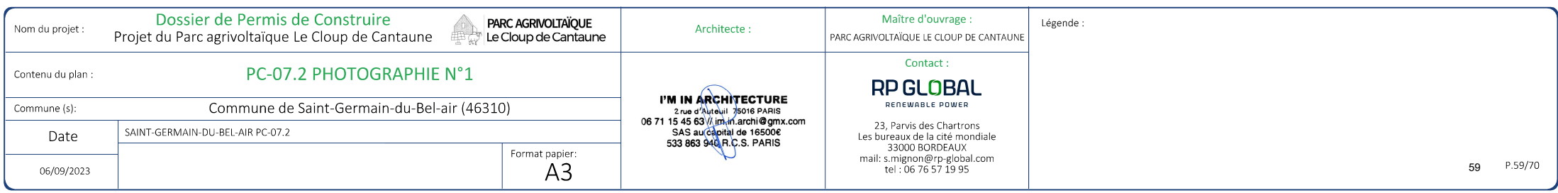
Point de vue n°1 - situé au niveau de l'accès sud du site en direction du nord

Localisation de l'emprise clôturée du projet