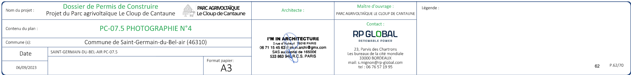
Point de vue n°4 - situé au sud-ouest du site en direction de l'est

Localisation de l'emprise clôturée du projet